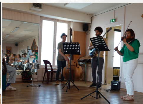
AUDITIONS DE MUSIQUE