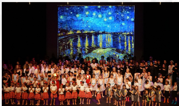
GALA DE DANSE AU CARGO