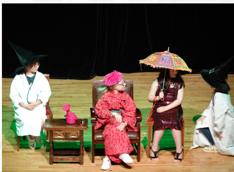
REPRESENTATION DE THEATRE